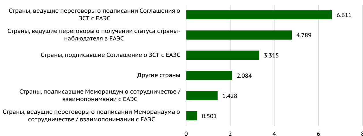
Рис. 3. Средний уровень товарооборота ЕАЭС со странами, в зависимости от их статуса 1 , 2020 г., млрд. долл. США / Fig. 3. Average Level of EAEU Trade with Countries, Depending on Their Status 1 , 2020, USD bln

Тем не менее, определенную взаимосвязь имеют товарооборот ЕАЭС со страной и ее текущий / потенциальный статус в ЕАЭС (рис. 3).