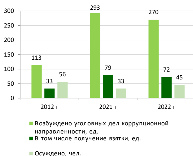
Рис. 1. Результаты работы спецподразделений таможенных органов по противодействию коррупции / Fig. 1. Results of Anti-Corruption Work of Special Units of Customs Authorities

Анализ реализации антикоррупционной политики таможенных органов Российской Федерации за последнее десятилетие показывает, что количество возбужденных уголовных дел в отношении коррупционеров в настоящий период соответствует в среднем 280-300 дел, что, с одной стороны, определяет, безусловно, качество работы правоохранительных структур, но по факту нарушителей не становится меньше, по отдельным позициям определяется рост (рис. 1).